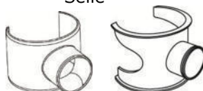
Réduction ext concentrique